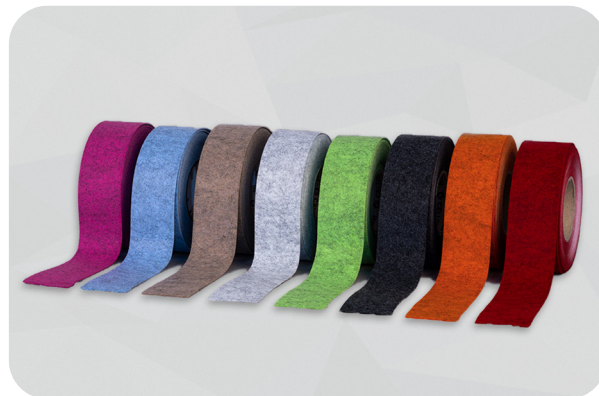
Rubans adhésifs de feutre soni VLD

► Finition auto-adhésive à la base d'acrylate