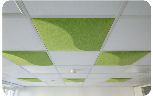
Bsp. Deckengestaltung mit soni COLOR Design YinYang