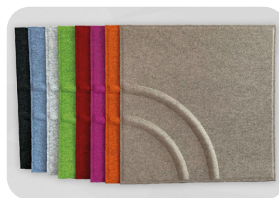
soni COLOR Design Wave