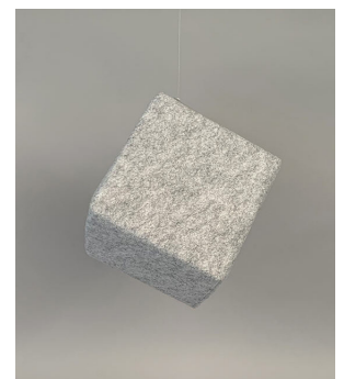
Abgehängt von der Decke